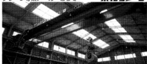
1955年に創業以来確実な歩みと共に蓄積したノウハウと信頼を御納入致します