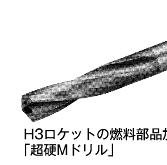
H3ロケットの燃料部品加工に採用された「超硬Mドリル」

超硬Mドリルは、H3ロケットの燃料部品加工に採用された。超硬Mドリルは、H3ロケットの燃料部品加工に採用された。