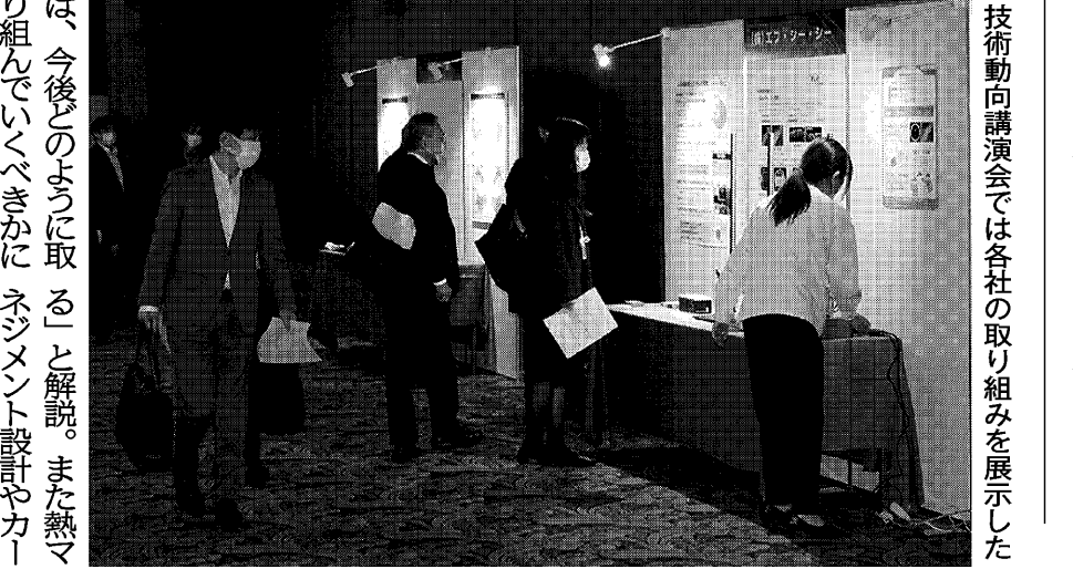
技術動向講演会では各社の取り組みを展示した

浜松地域イノベーション推進機構の次世代自動車センター浜松(浜松市中区)は、地域の中小企業向けに電動化やカーボンニュートラル(温室効果ガス)