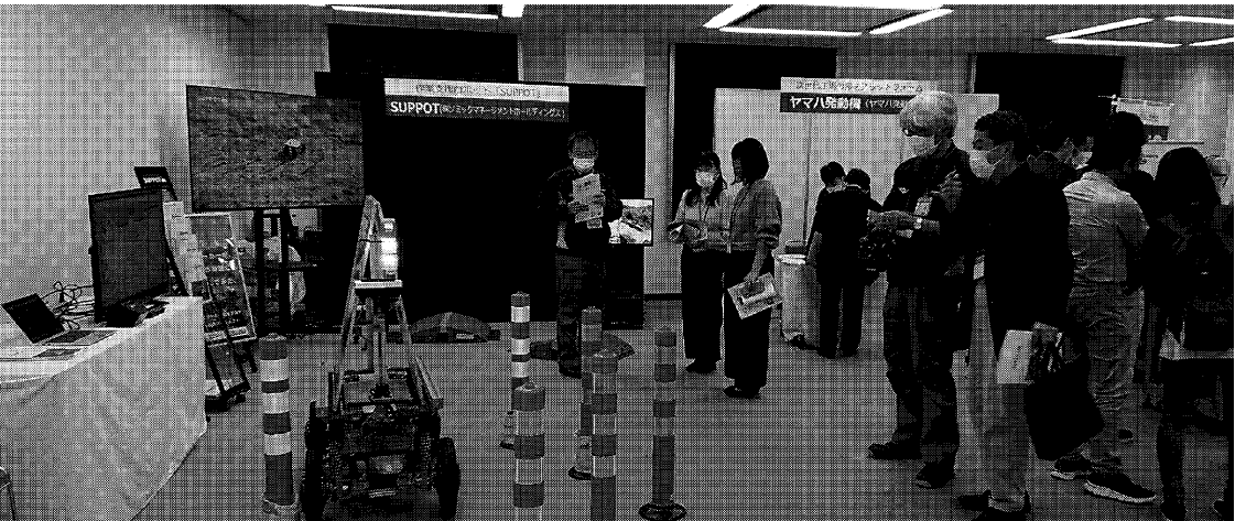
中小企業にも自動化のニーズが高まる中開催された「ハマロボ展」

22年11月には産業初開催し、地元7社が出展。地元ロボット7社が出展。地元の中用・協働ロボットの展示システムインテグレーション「ハマロボ展」をテーマ(SI&E)関連はヤマハ発動機や日本設計工業(浜松市北区)などが出展し、フィナックや安川電機など