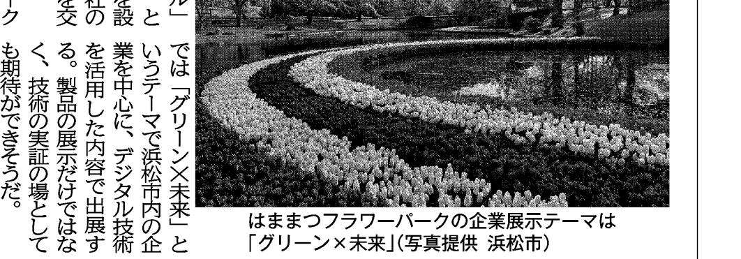
はままつフラワーパークの企業展示テーマは「グリーン×未来」

20周年の節目に再び浜名湖で開催 花や緑とデジタル技術融合 24年3月には「浜名湖花博2024」が開催される。博「は現在でも覚えている。両会場では地域20年前の04年の4月に開催 市民も多く、地元にとりて印象深いイベントだ。今回のテーマは「人・自然・テクノロジー」の架け橋を築くこと。浜名湖デジタル田園都市」花や緑とデジタル技術が融合した新たな展示が見られる。浜名湖花博2024は「浜名湖デジタル田園都市」をテーマに、企業や団体が自社の製品、技術、サービスを交えて展示する。はままつフラワーパークも期待がもたれている。