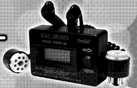
Bias Checker TEC-BC1

適合真空管: 6L94, 6CA7, 5881, 6L6GC, 6V6GT, 6550C, KT66, KT77, KT88, KT90, KT120, KT150, KT170 日本製