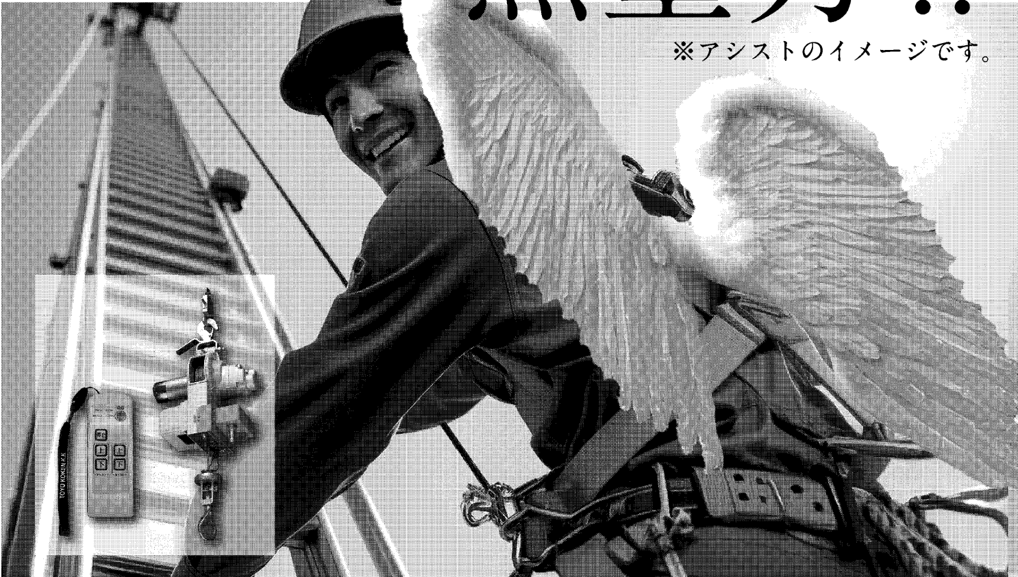
昇降アシスト装置