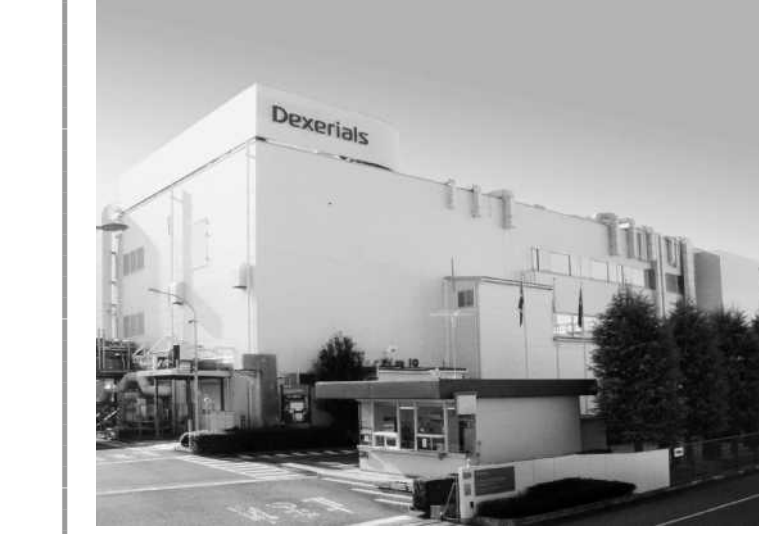
異方性導電膜の生産能力を増強する鹿沼事業所第2工場

デクセリアルズは鹿沼インター産業団地内に取得した7万1000平方メートルの敷地で、鹿沼事業所第2工場の拡張工事を行う。総投資額は300億円規模。第2工場は製造する異方性導電膜（ACF）の生産能力を拡充する狙い。同社新商品も手掛ける。拡張した工場は2026年度中の稼働を見込む。 第2工場ではデジタル変革（DX）化を順次進める。生産性向上に向けてプロセスの自動化、ロボット活用を進める。人工知能（AI）による生産計画の自動化、適正化は業務プロセスの最適化につながる。品質向上のため異物探知や品質データのリアルタイムモニタリングを実施。製造現場のリアルタイムオペレーションを高める。異方性導電膜の生産能力を増強する鹿沼事業所第2工場