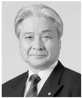
栃木県知事 福田 富一氏

東京圏から好アクセス 低い大規模地震リスク 栃木県は東京から約100キロ圏内にあり、東北自動車道や東北新幹線が南北に走り、北関東自動車道が東西に走るなど、東地方における交通の要所に位置し、東京圏からのアクセスは抜群の環境であり、また大規模地震のリスクが低いと見込まれており、企業にとってのリスク分散、事業継続計画（BCP）の観点からも拠点整備の適地であると考えられています。加えて本県の工業地の平均価格は、関東圏内で最も安い価格となっており、価格面でも企業が投資しやすい条件を備えています。本県では企業ニーズに応えられるよう産業団地の整備に積極的に取り組んでまいります。 具体的には、現在、「鹿沼インター産業団地（鹿沼市、および「しもつけ産業団地」〔下野市〕の整備を進めているほか、昨年9月の壬生町における新産業団地開発の事業実施の決定に加え、11月には足利市における新たな産業団地開発に向けた基礎調査実施を決定するなど、企業の皆さまに切れ目のない産業団地を供給できるよう努めています。 特に、鹿沼インター産業団地については、第2期（3、4街区）予約分譲案内を開始したところであり3月1日から29日までを申込期間としておりますので、新たな投資計画をお持ちの企業様には、まずは栃木県を第一候補としてご検討をお願いいたします。