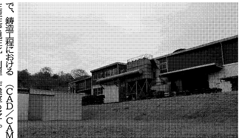
平野鑄造所は木型倉庫を新設する

平野鑄造所（掛川市）は、荷役作業者の転落防止対策として、トラックの荷台と作業者の間に設置する「ステップマシ」を開発、発売した。この装置は、トラックの荷台と作業者の間に設置することで、作業者の安全な昇降を補助する。また、転落防止の役割も果たす。この装置は、トラックの荷台と作業者の間に設置することで、作業者の安全な昇降を補助する。また、転落防止の役割も果たす。