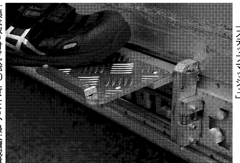
作業者の安全な昇降を補助する「ステップマシ」