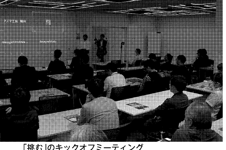
「挑む」のキックオフミーティング

25年3月までにさまざまなセミナーを開催する。デザイン思考を身につける3日間のワークショップや新規事業や参入に挑むためのイベントを企画している。9月からは限定15社に向けた「新規事業創出プログラム」として、ユニコンファーム(東京都渋谷区)と連携し、さまざまな新規事業計画の策定を支援する。