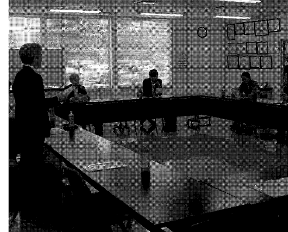
青年部は静岡銀と連携して定例会を開いた