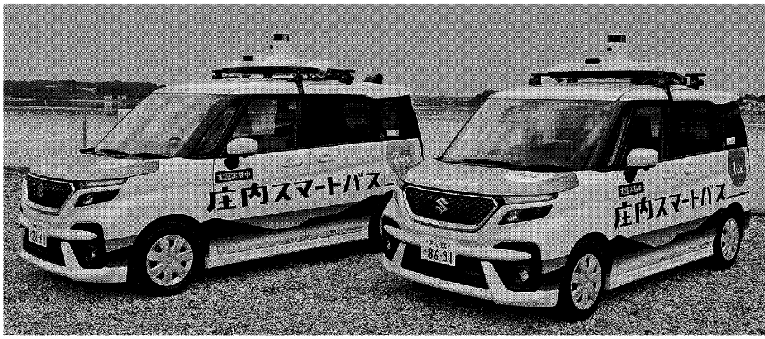
浜松市内での実証実験で使用する車両

スズキは相次いでスズムで使う車両の開発・スタートアップに出資。生産などの協業を検討し、協業先を拡大していき、6月にはテスラ、スカイドライブ、イアフォー(名古屋)市「スズキ・グローバル(愛知県豊田市)」との中村区)と自動運転技術「スズキ・グローバル」の協業では、空飛ぶクルマの研究開発や社会実用化を目指し、スズキが技術的支援を担い、スカイドライブが製造を担当する。スカイドライブは、スズキの製造技術を生かし、スタートアップと協業する。スズキは路線バスが廃止となった地域などで住民の足となる自動運転バス「SKYDRIVE」を開発し、スカイドライブは、スズキの製造技術を生かし、スタートアップと協業する。