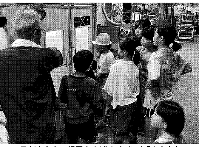
子どもたちの視野を広げるイベント「大人力」

次世代の担い手確保は今や製造業の最大の課題になっている。若手不足に悩む企業は、子どもたちにモノづくりの楽しさを伝えるため、夏休み期間中は各地でさまざまなイベントが開催された。 浜松市東区は、企業と近隣住民、職業体など連携して中学生など計120人が参加した。当日は本工場の工場内印刷機、細かい網目の孔にインクが通る部分と通らない部分を作って版にする手法。