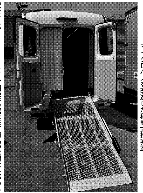
マイクロバスを改造した移動式授乳室

スター精密は自動ドリルユニットは、5車・油圧・空圧装置など、力所をカトリック式のボジションとし、加工部品の形状に応じて多様な加工ユニットが装着可能。上部に配置した穴開け工具用スリッパホルダーは4軸型と5軸型のいずれかを選べる。時間延長に備え、部品を置く。