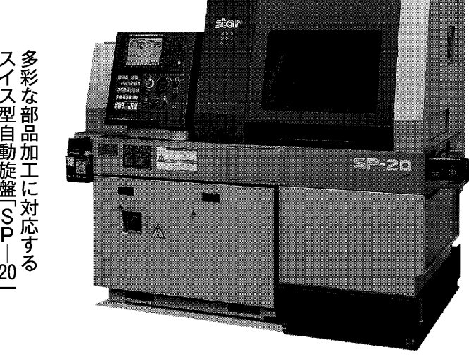
多彩な部品加工に対応する スライズ型自動旋盤「SP-20」

より、相談件数が従来比で割増増えたといい、充電できる容量20kWhのバッテリーから取るため、エンジンを停止していても8~10時間稼働可能。浜松市東区は、マイ程度稼働する。バッテリーは非常用電源としても活用できる。後部には折り畳み式のスロープやカーテン、側面はサイドオーニングを配置した。車室を有効活用できるように、これまで開発した移動式分煙室やPCR移動検査車などの設計ノウハウを活用して部品の配置を工夫した。